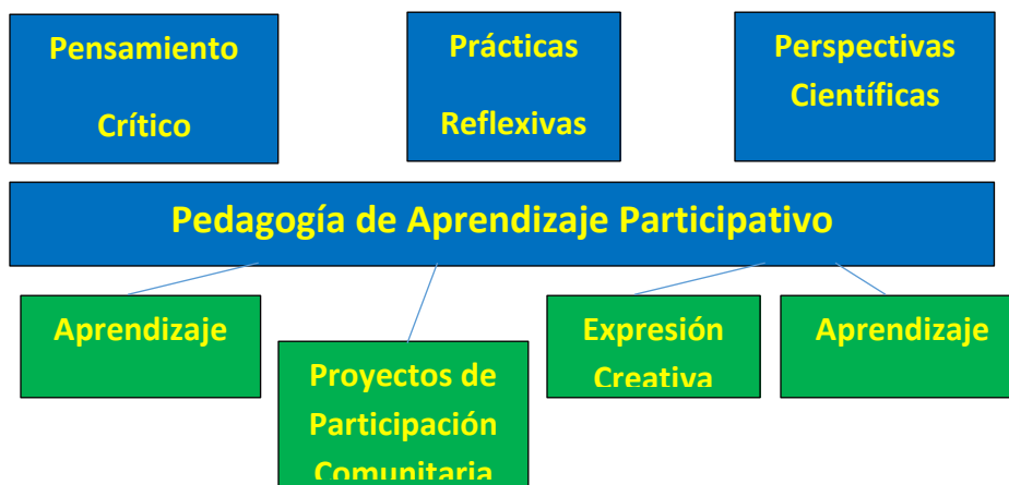
Figure 4 – Líneas Claves de Aprendizaje