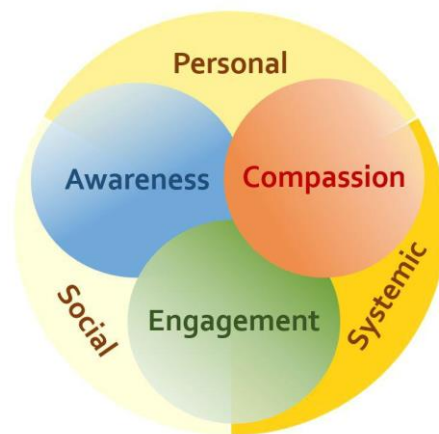
Figura 1: Dominios y Dimensiones

Para poder actuar de forma constructiva – tanto individual como colectiva– primero, el individuo, debe hacerse consciente del asunto o problema; segundo, debe cuidar y desarrollar una inversión emocional que genere la motivación para actuar; y finalmente, debe saber cómo actuar hábilmente.